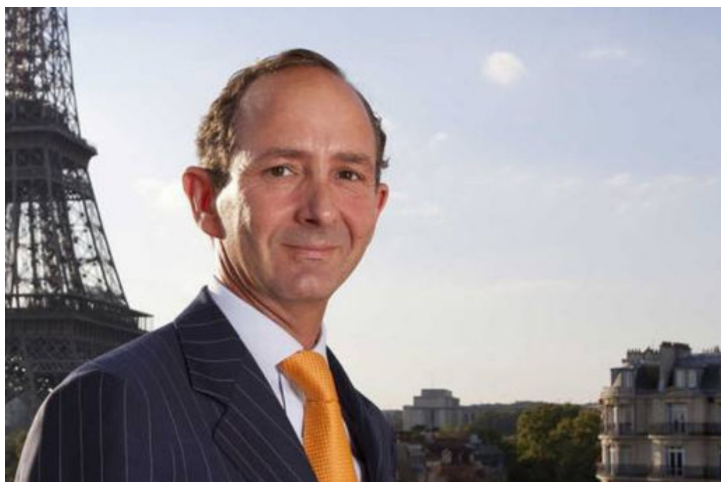
La fintech Aston iTrade Finance lève 6 millions d'euros pour croître à l'international

LEVÉE DE FONDS Aston iTrade Finance a levé 6 millions d'euros notamment auprès de Seventure Partner (Natixis) pour accélérer son développement à l'international. La fintech nancéienne qui a réalisé 978% de croissance sur quatre ans, compte cibler le marché allemand, un des plus importants en Europe dans son secteur.